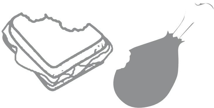
Restos de Comida