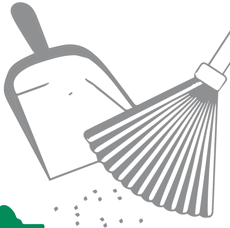
Residuos de Barrido