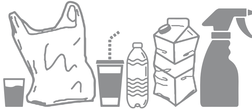
Bolsas y Envases de plástico [incluye plástico liviano ICOPOR]

Recuerda que todos los materiales deben estar limpios y secos_