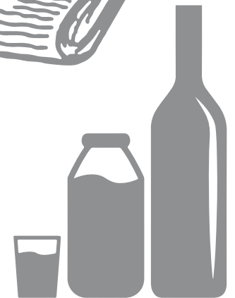
Envases de Vidrio