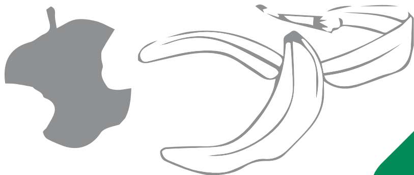
Cáscaras de Frutas